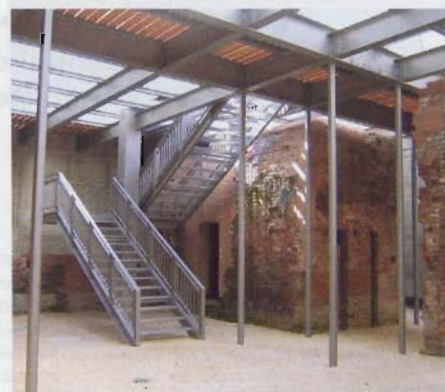
Reste der Bundesfestung sind wieder erlebbar.

staltung ist sehr zurückhaltend, um seine vorhandenen Gegensätze spürbar zu machen: alt und neu, eng und offen, hell und dunkel.