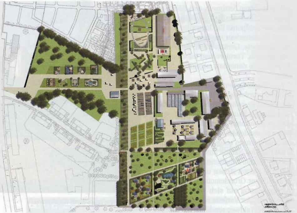
Der zukünftige „Grünzug im Vorfeld“ wird zum gärtnerischen Informationszentrum.

Eine 750 m lange „Carrera-Skatebahn“ ermöglicht die Nutzung und Erprobung von trendigen, mobilen Sportgeräten. Daran anschließend wurde ein einzigartiger Skatepark realisiert, der zusammen mit der Schweizer Fachfirma Bowl Constructions entwickelt wurde. Statt eintöniger Einzellemente von Fertigteilherstellern wurde die Anlage vor Ort modelliert und mit einem mehrschichtigen Aufbau aus Spritzbeton überdeckt. Neben Bereichen, die auch