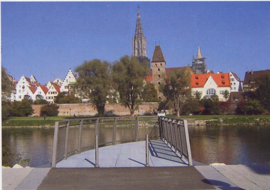
Aussichtsteg an der Donau mit Blick auf die Ulmer Altstadt.

sche Stadt an der Donau“. Dadurch entstand auch im Bezug auf die Landesgartenschau eine große Aufgeschlossenheit gegenüber neuen und experimentellen Ideen. Die gesamte Schau präsentiert sich in einem frischen, frechen Design und mit neuen Inhalten, die eine weit gehende Abkehr vom manchmal angestaubten Image einer „Blümchenschau“ bedeuten.