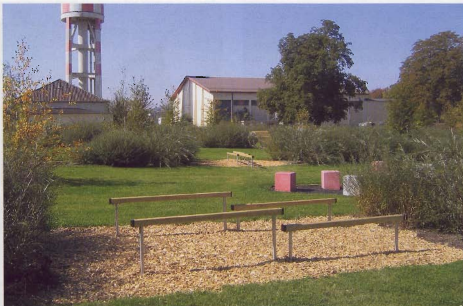
Hindernisparcours durch Weidenstreifen.

Als ruhiger Gegenpol zu den Aktionsangeboten wurden auf einer abgesenkt liegenden Wiese zwischen einem historischen Verteidigungsbauwerk der Bundesfestung (der so genannten „Vorfeste“) und einem Baum bestandenen Wall behutsam einige Gartensequenzen eingefügt. Es entsanden kontemplative Räume aus unterschiedlich hohen Hecken, Schattenstauden und Farne. Die Gärten stehen unter dem Motto menschlicher Grundemotionen und laden zur Besinnung auf sich selbst ein. Der Baumgürtel der Vorfeste wird durch einen schlichten Waldweg erschlossen, der auch ein Gelenk schonendes Joggen ermöglicht.