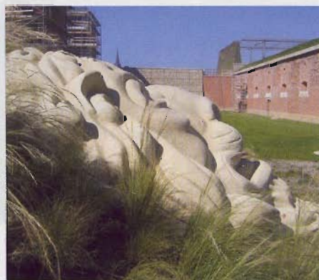
Das Wappentier Bayerns wurde als überdimensionaler Wasserspeier zum neuen Wahrzeichen.