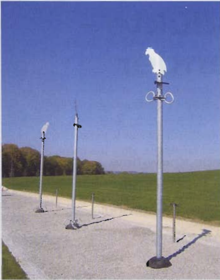
„Klettertotems“ auf dem Bonanzaspielplatz.