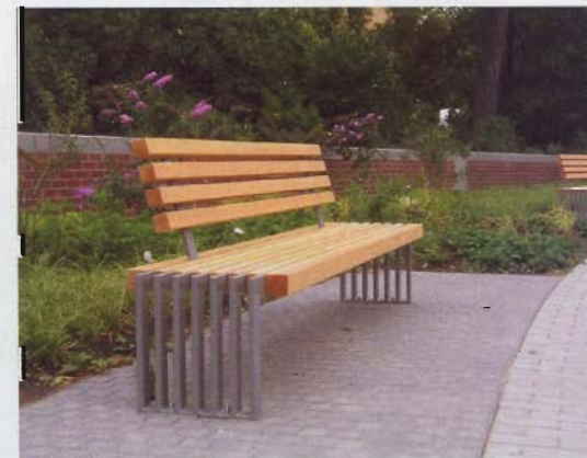
Für die Alle Gartenschaubereiche wurden mit einer eigens entworfenen Möbelserie ausgestattet.