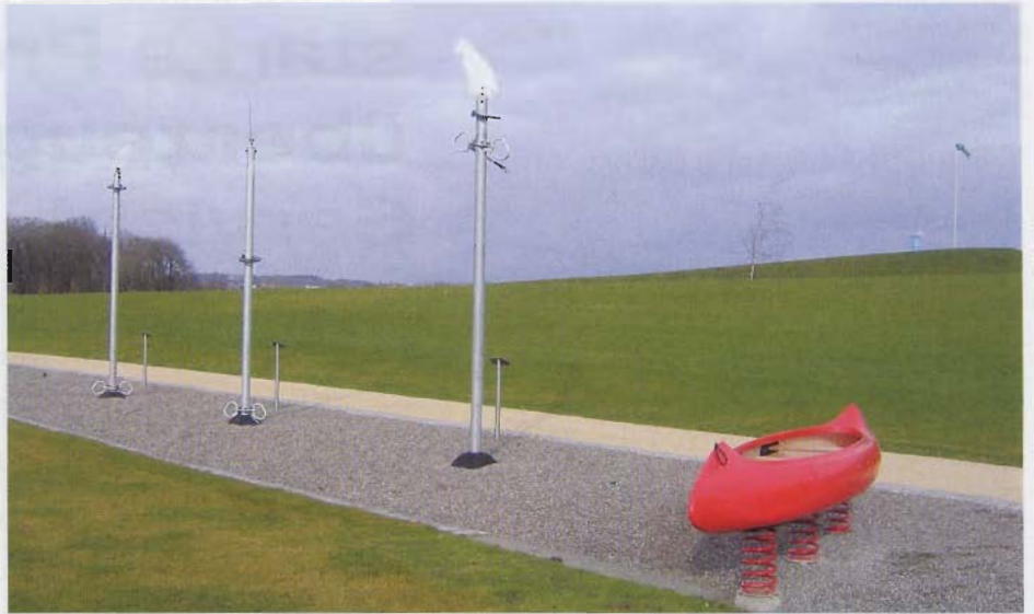
„Bonanzaspielplatz“ mit Klettertotems und bespielbaren Kanadiern.