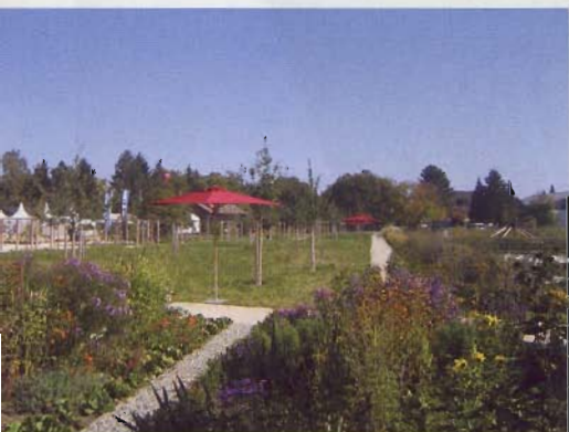
Staudenbeete, Musterkleingärten und Streuobstwiese.

Die Bereiche für eine zukünftige Friedhofserweiterung und die Freiflächen der ehemaligen Stadtgärtnerei wurden in das Ausstellungskonzept der Landesgartenschau einbezogen. Die Grundstrukturen dieser Schauanlagen bleiben nach der Schau erhalten und werden zu einer dauerhaften