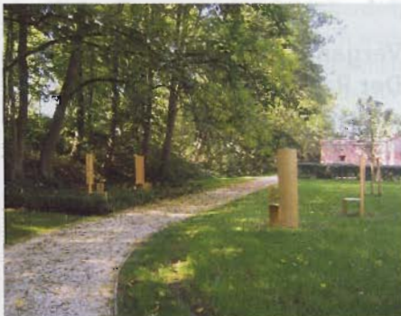
„Verborgene Gärten“ vor einem abge-senkt liegenden Verteidigungsbauwerk.

Anfängern einen Einstieg erlauben gibt es geradezu halsbrecherisch wirkende Bowls, die sich schon zum Baustellenfest im letzten Herbst zum Besuchermagnet entwickelten. Die Anlage erfreut sich seit der Fertigstellung einer solchen Beliebtheit, dass inzwischen Sand eingebracht werden musste, um die Skater vor dem gefährlichen Betreten der Baustelle abzuhalten.