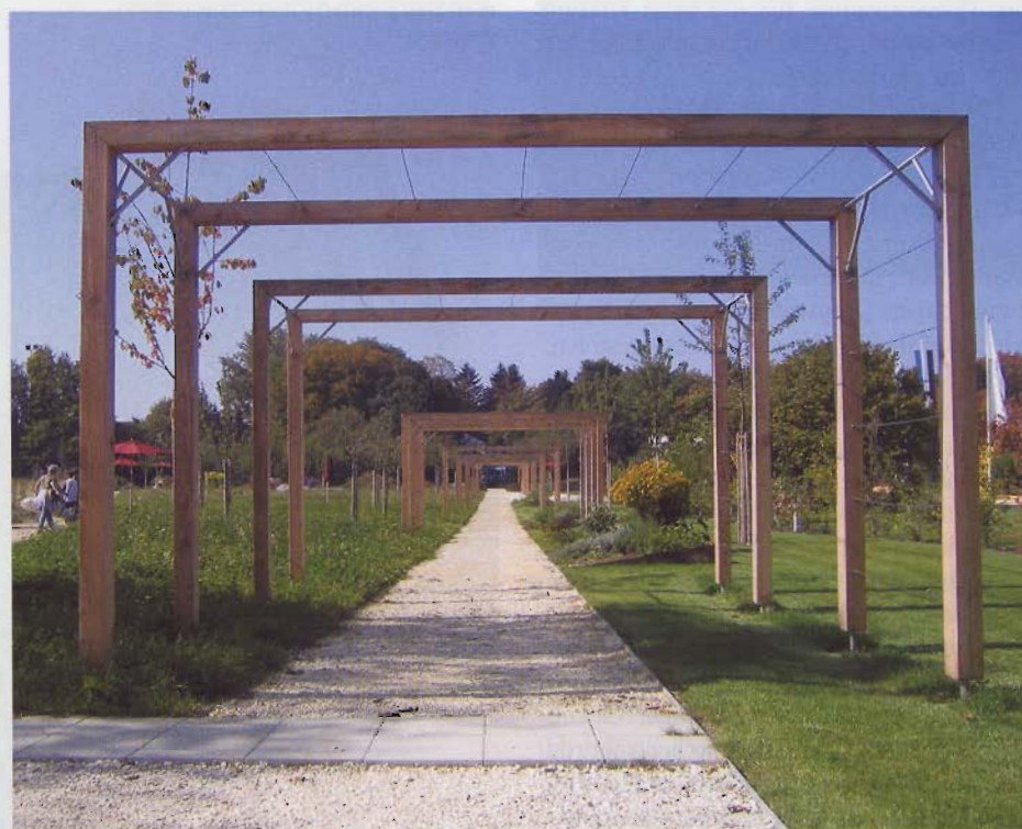
Pergolengang mit Kletterpflanzen und öffentlichen Kräuterbeeten.

Zur Gartenschau wird das Gelände zum Treffpunkt für Garten- und Naturfreunde jeden Alters. In Form einer „interaktiven Gärtnerei“ werden Anregungen und Neuigkeiten rund um die Themen Pflanze und Natur präsentiert. Die nach Themenschwerpunkten gegliederten Ausstellungs-