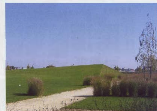
Ein rund 6 Meter hoher Aussichts- und Kletterhügel bildet zugleich die Raumkante des Parks.

Kinder, Erwachsene und Senioren bieten. Er soll zum Modellprojekt eines nutzungs-offenen „Generationenparks“ werden, der