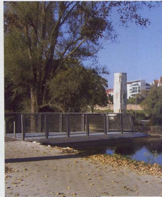
Aussichtstegen in Flügelform erinnern an den berühmten „Schneider von Ulm“.

Die Anlage von altersspezifischen Spiel- und Sportangeboten halten wir für nicht mehr zeitgemäß. Der Park Wiley soll deshalb von allen Altersgruppen nutzbare Angebote für Gymnastik, Spiel und Sport für